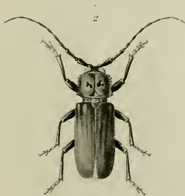
1 Ergates waltherdotii Choe 2 Prionobius Atropos Choe